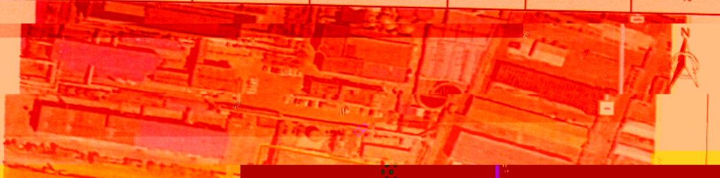
图 1 无组织废气检测布点示意图